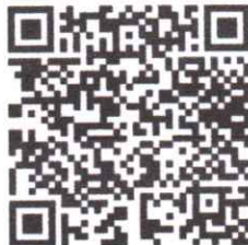
QR Code ตามข้อ ๘